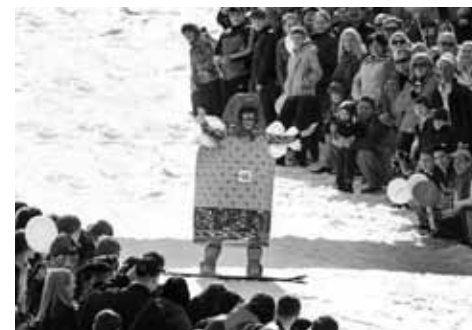
Матрёшка мчится на доске

Умудрился смастерить на сноуборде целый корабль! Ну, далеко он не уехал (или не уплыл?), но за его передвижением было интересно наблюдать.