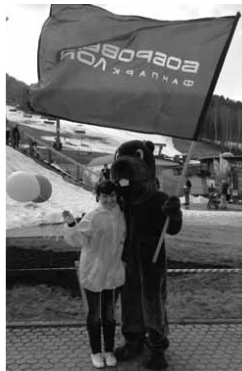
Мне медведи нипочём.

А еще всех поразила ракета. Эка невидаль! Согласна. Но когда эта ракета плюхнулась в воду, её еле вытащили, потому что она была сделана из поролонa и, соответственно, впитала в себя уйму воды.